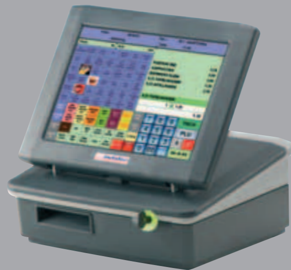
Abbildung: INKA 440 mit Bondrucker