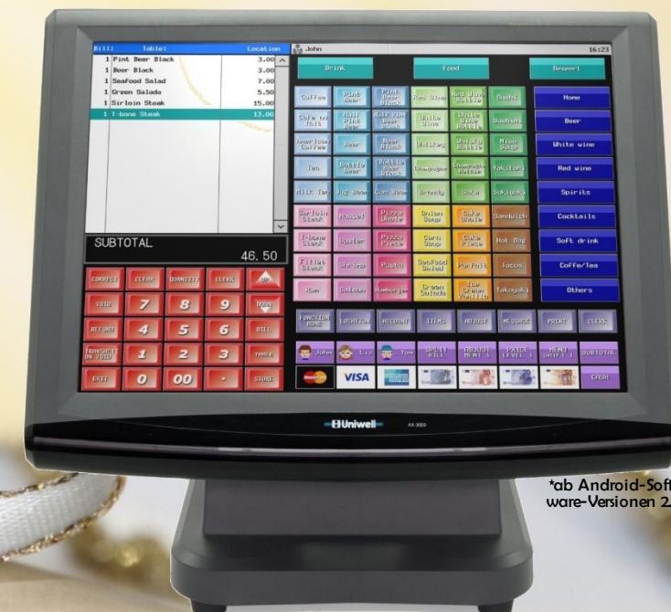
*ab Android-Software-Versionen 2.2

Wir können Ihnen hier unsere WTP150II-Drucker mit patentiertem drahtlosen Kabel empfehlen. Einfach anschließen und loslegen – denn ein Kabel ist nicht erforderlich. Nur eine Steckdose sollte dort vorhanden sein, wo Sie Ihren Drucker benötigen.