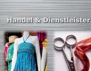
Handel & Dienstleister